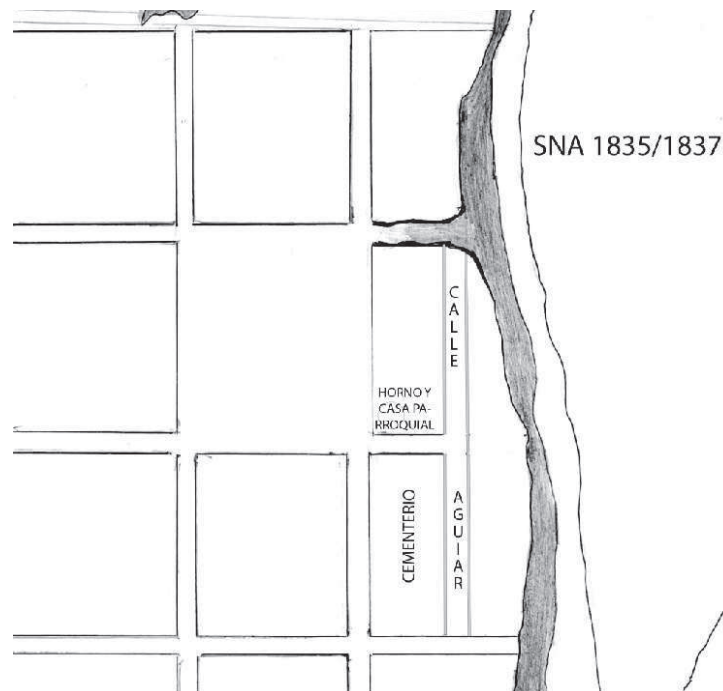
San Nicolás de los Arroyos (1835-1837).-